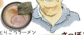
とりこっラーメン

おすすめは <とりこっラーメン> 白濁したスープはあっさり..だけどコクがある。 麺は自家製、かんすい少なめの手もみ麺。 エルモールカードOK!! まるとくは..